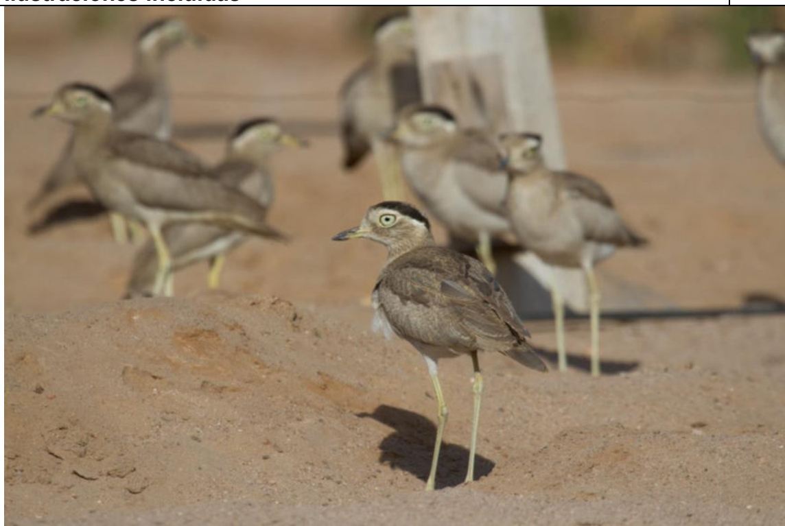
Chorlo cabezón.