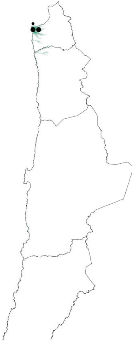
Distribución en Chile de B. superciliaris . Círculos grandes indican reproducción confirmada y círculos pequeños indican reproducción posible. Peredo (2018)