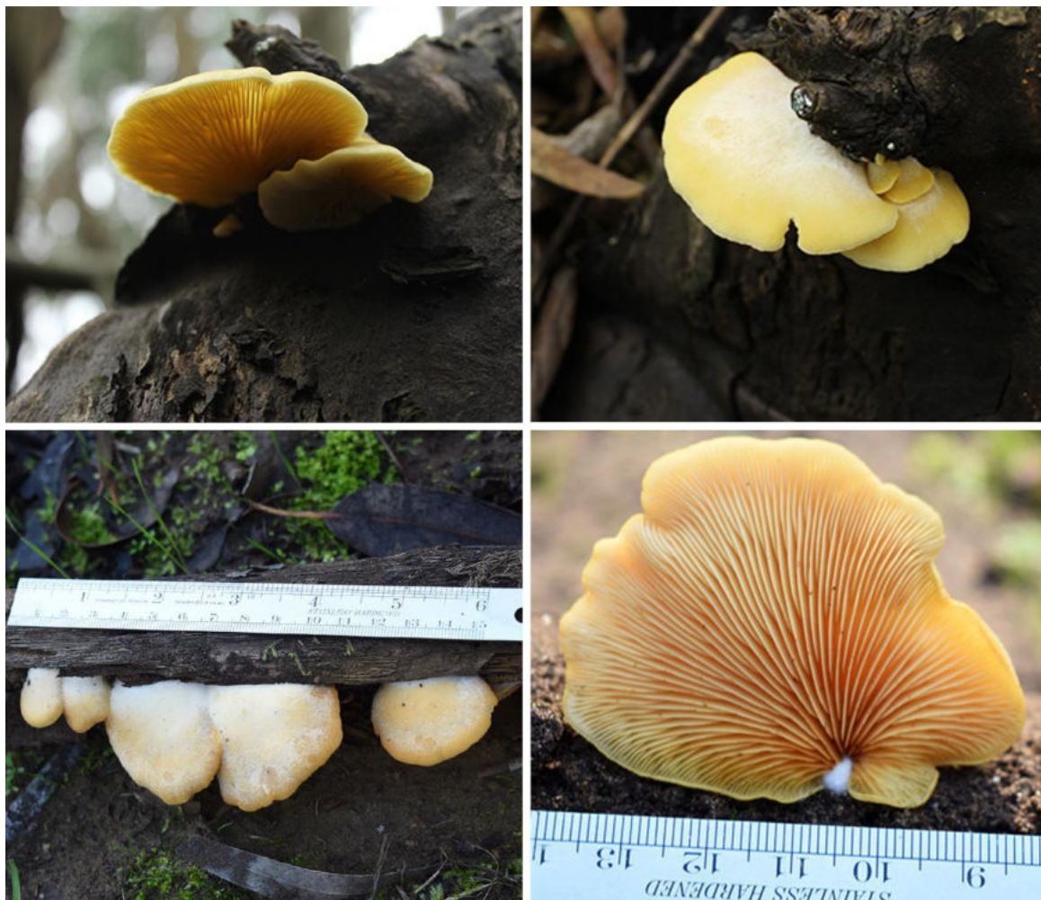
Figura 1: Basidiomas de Crepidotus brunswickianus en distintos ángulos.