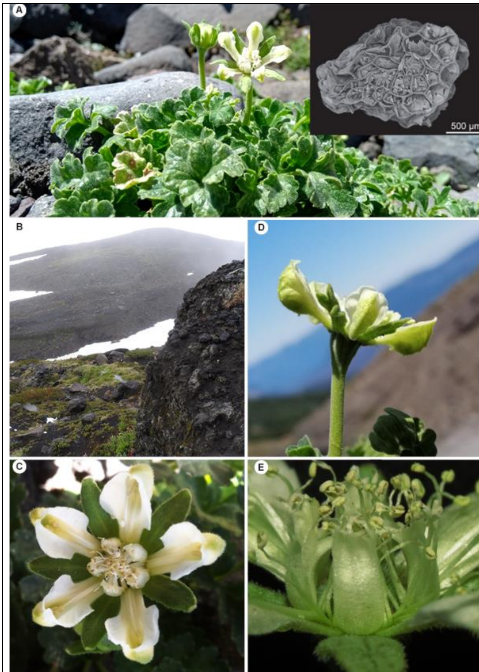
Figura 1. A, hábito y semilla. B, hábitat en Parque Nacional Conguillío. C, flor. D, flor vista lateralmente. E, escamas nectaríferas.