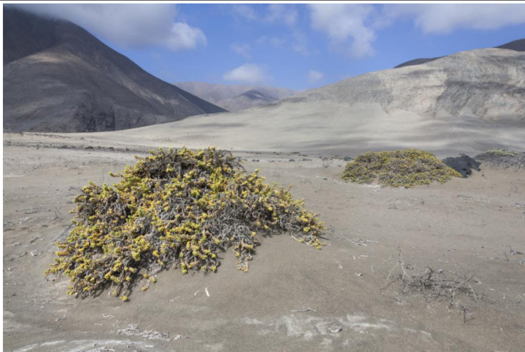
Fig. 3. Hábitat de Nycterinus (Paranycterinus) barriai Peña, 1971 (Coleoptera: Tenebrionidae) en Monumento Natural Paposo Norte, Región de Antofagasta, Chile.

Observaciones (adjunte comentarios y sugerencias que desee formular, así como cualquier otra información adicional que estime pertinente indicar)