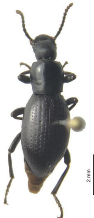
Fig. 1. Vista dorsal de un macho de Nycterinus (Paranycterinus) barriai Peña, 1971 (Coleoptera: Tenebrionidae).