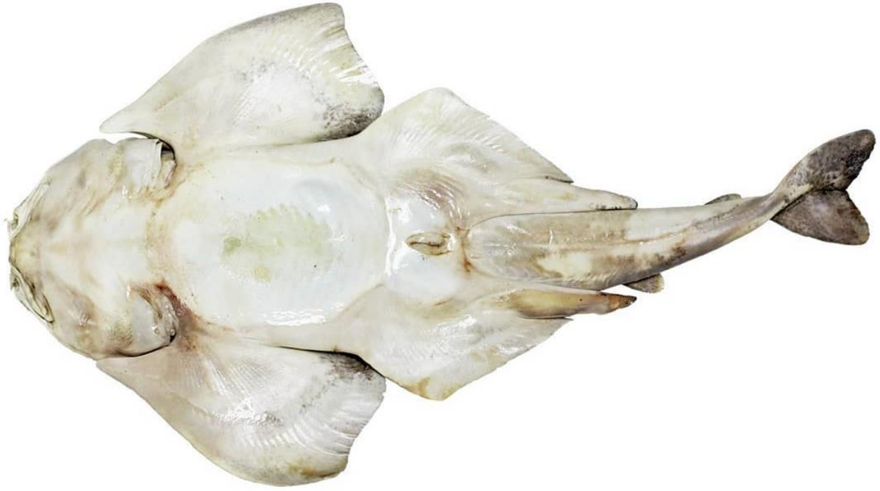
Vista ventral de ejemplar adulto de Squatina armata . Valparaíso, Chile.