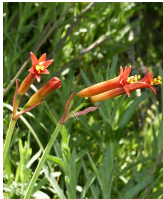
Región Metropolitana, Caleu