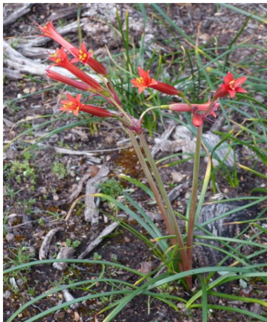
RM: Altos de Chicauma de Lampa

Ilustraciones incluidas (Adjuntar, si es posible, imágenes de la especie en cuestión, incluido mapa de distribución, en formato SIG en caso que así los tenga. Debe señalar la fuente de cada imagen. En caso que la imagen sea de vuestra autoría, señale si ella puede sea utilizada en la página Web del sistema de clasificación de especies y del inventario nacional de especies, ver http://especies.mma.gob.cl )