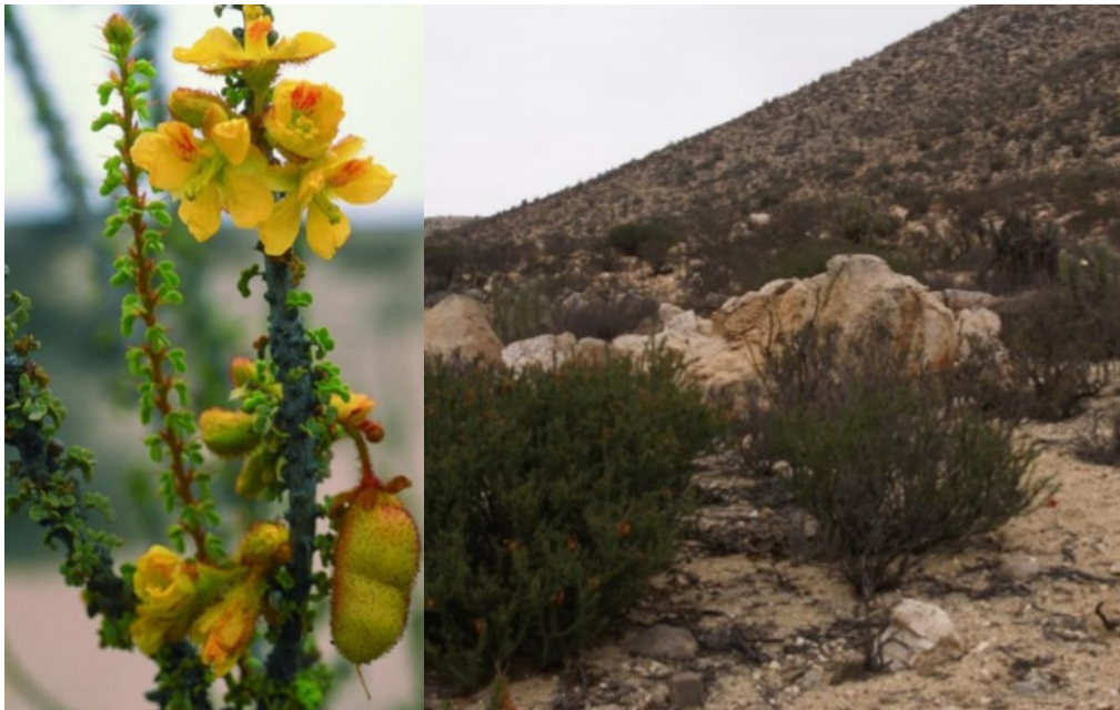
Figura 1. Fotografía de Balsamocarpon brevifolium , a la izquierda se detalla su flor, fruto y hojas, mientras que a la derecha se denota su hábitat y hábito arbóreo