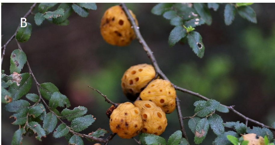
Figura 1: A) y B) Estromas maduros de Cyttaria johowii sobre ramas de N. dombeyi.

(Las imágenes incluidas pueden ser utilizadas, pero respetando la autoría).