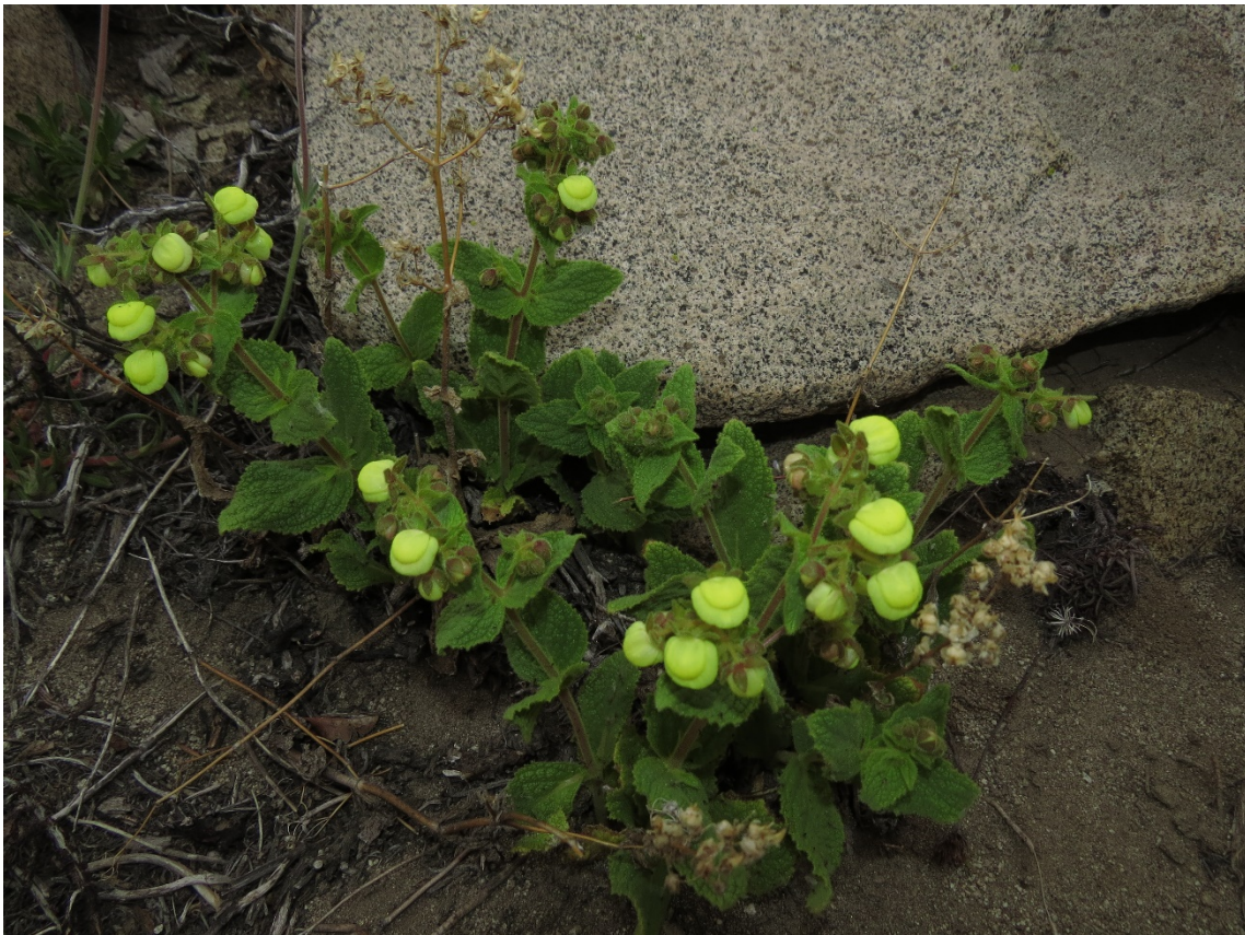
Figura 2. Calceolaria flava . Hábito de un ejemplar adulto. Cerro El Roble. 27-10-2020.