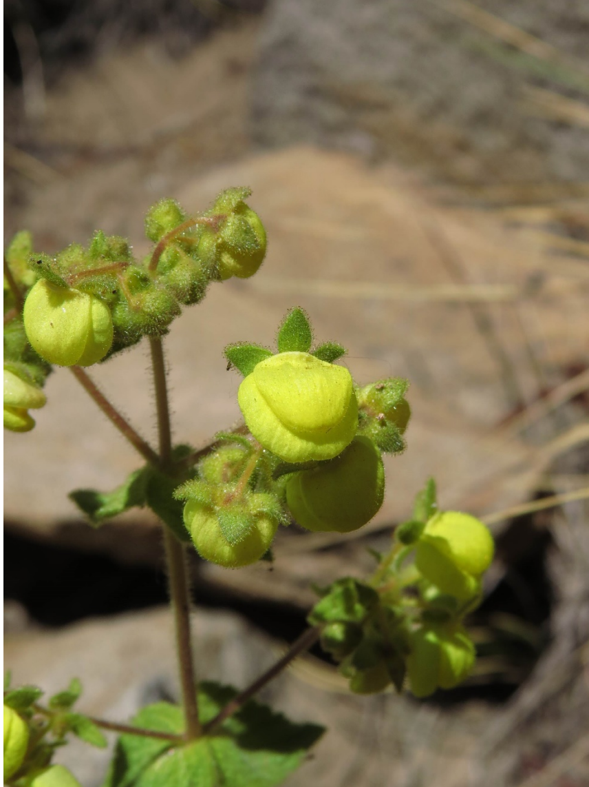
Figura 3. Calceolaria flavida . Detalle de la inflorescencia. Cerro El Roble. 13-12-2018.