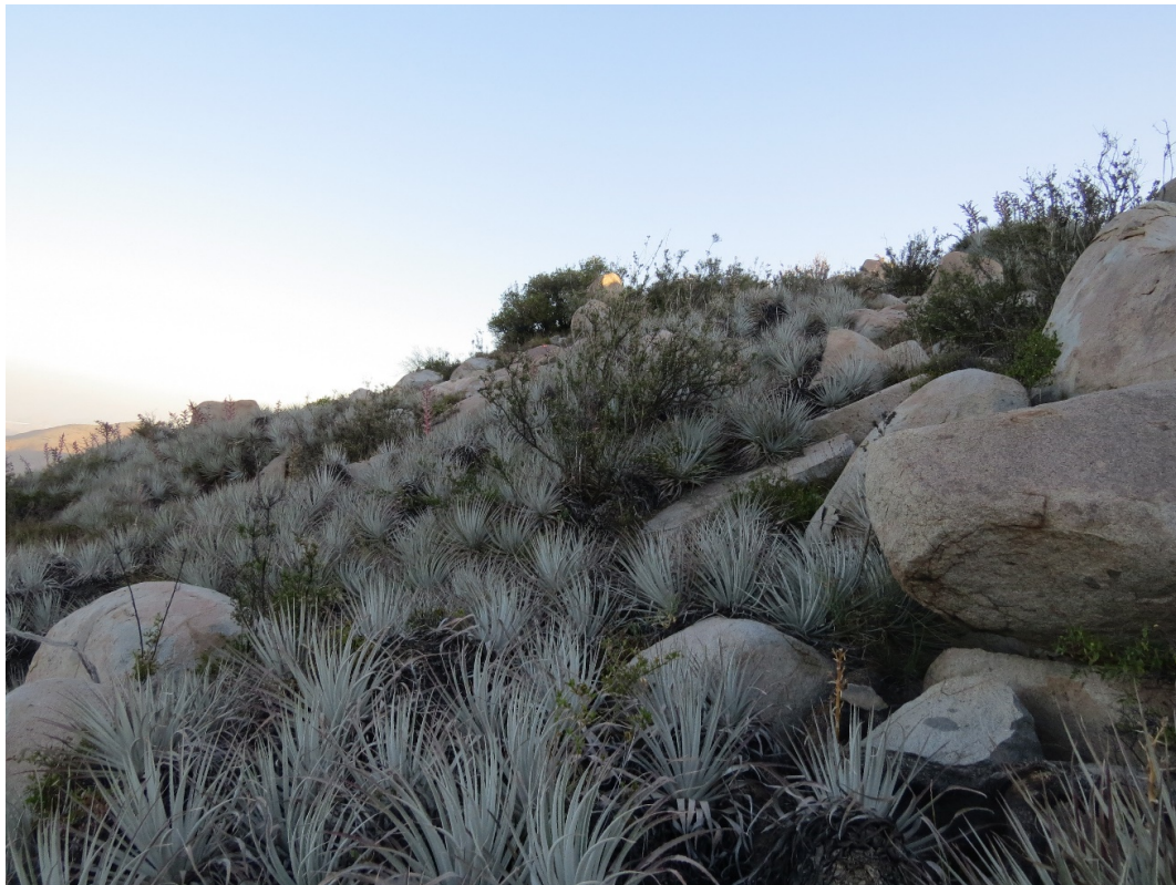
Figura 6. Calceolaria flavida . Detalle del hábitat. Cerro El Roble. 28-11-2019