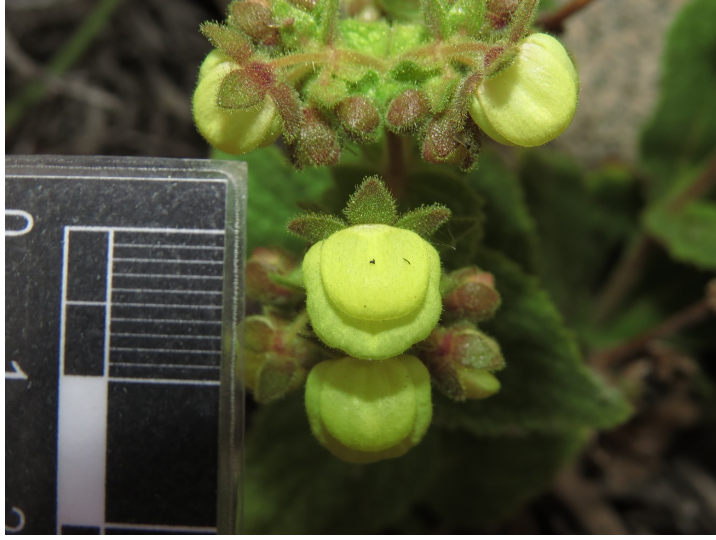
Figura 5. Calceolaria flavida . Detalle de las flores. Cerro El Roble. 27-10-2020