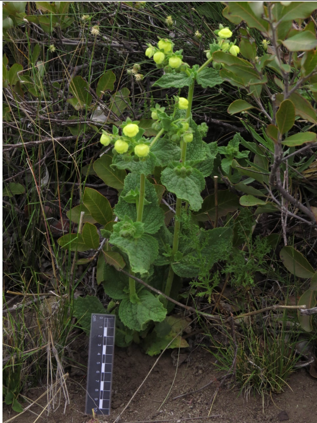
Calceolaria flavida . Hábito de un ejemplar adulto. Cerro El Roble. 27-10-2020.