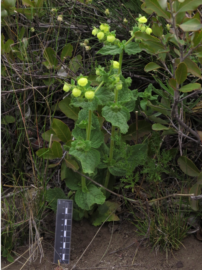
Figura 1. Calceolaria flava . Hábito de un ejemplar adulto. Cerro El Roble. 27-10-2020.