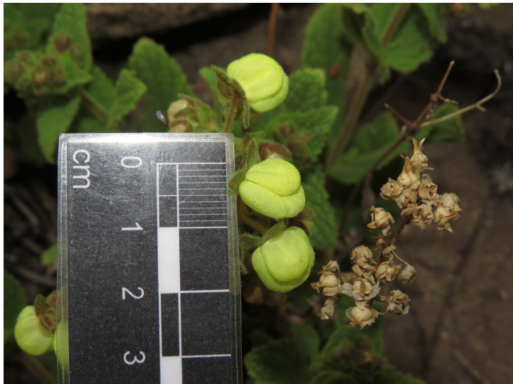
Figura 4. Calceolaria flavida . Detalle de las flores. Cerro El Roble. 27-10-2020.