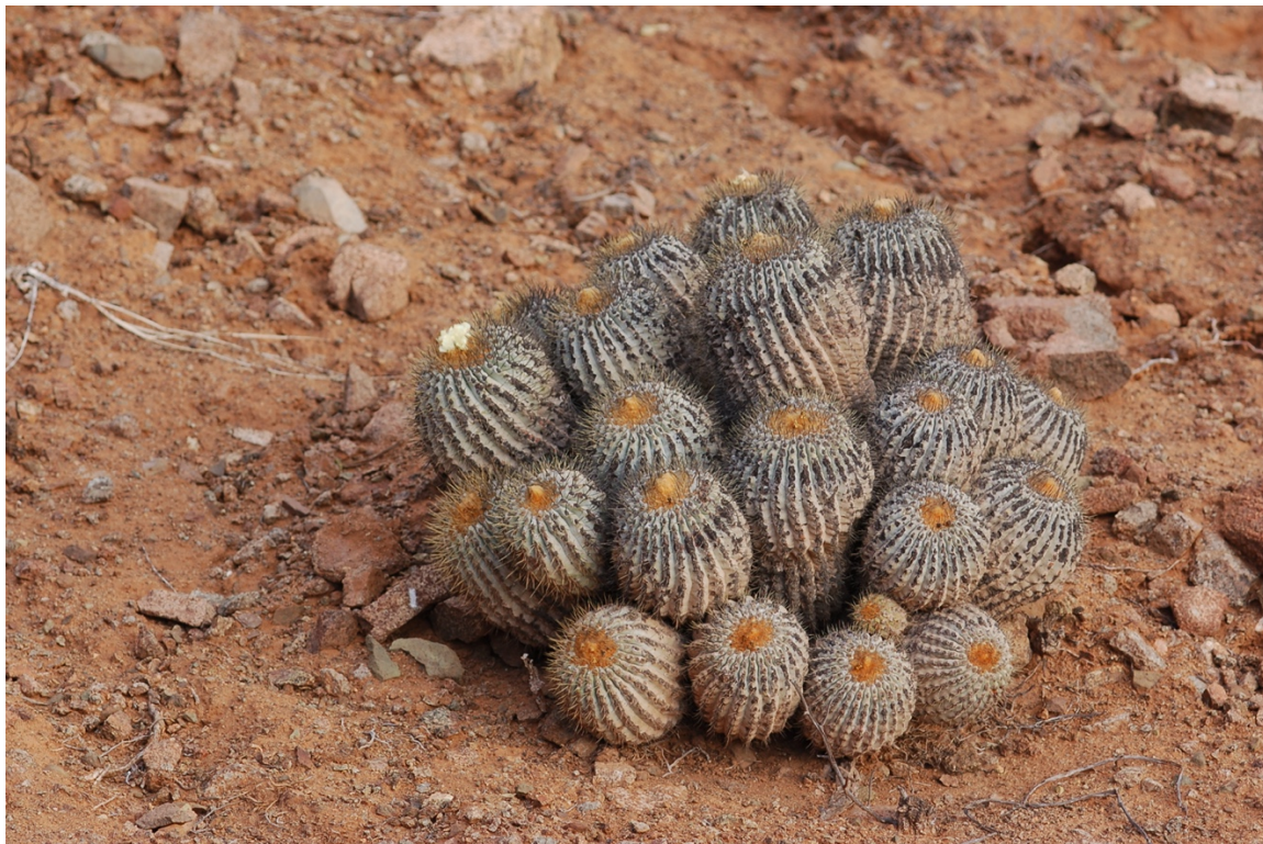
Figura 1. Individuo de Copiapoa gigantea .