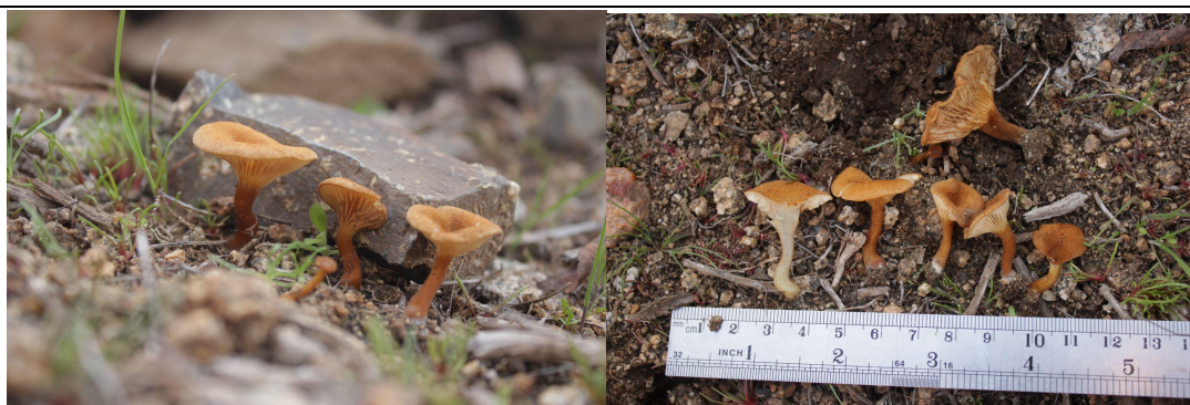
Figura 1: Basidiomas in situ de M. omphaliopsis. (Imágenes pueden ser utilizadas mientras se señala la autoría).