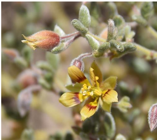
Flor de Metharme lanata (Galleguillo, 2021)