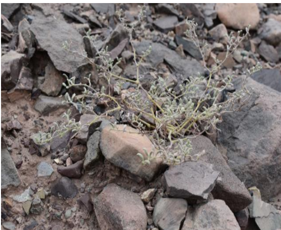
Individuo de Metharme lanata en perfil rocoso en ladera de cerro (Informe prospección Metharme lanata , 2021).