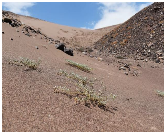
Población de Metharme lanata en sustrato arenoso, en formación de duna (Informe prospección Metharme lanata , 2021).