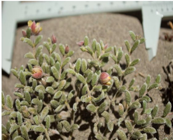
Individuo de Metharme lanata en sustrato arenoso, junio 2022.