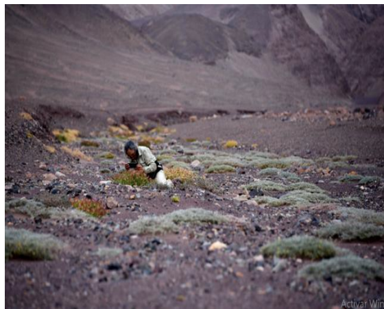
Formación de Metharme lanata en cojines. Quebrada Cahuiza (Informe prospección Metharme lanata , 2021).