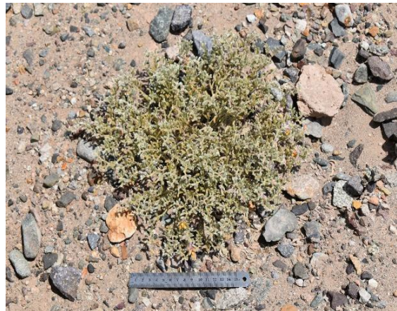
Individuos de Metharme lanata en sustrato de arena y gravilla, junio 2022.

Los antecedentes y fotografías pueden ser utilizados en las publicaciones y archivos del Ministerio de Medio Ambiente.