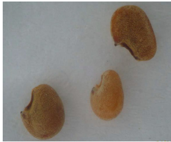
Semillas de Metharme lanata (Pinto, 2009).