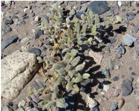
Planta juvenil de Metharme lanata sobre ripio (Pinto, 2009)