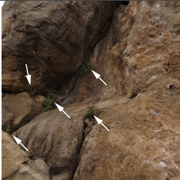
Figura 9. Rutas de escalada en medio del hábitat de Nicotiana rupicola . Fuerte Lambert, Coquimbo. 18-11-2021