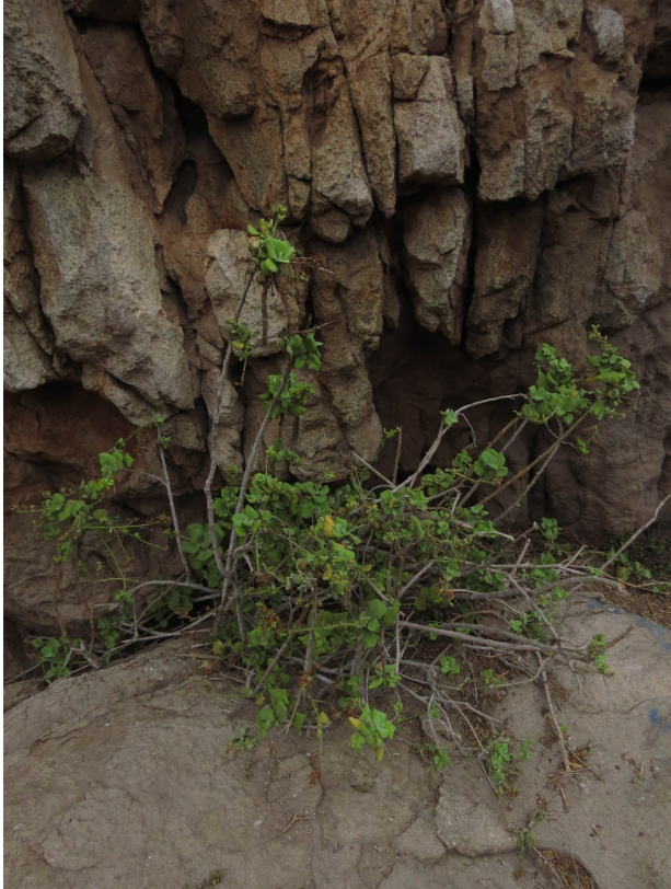
Figura 1. Nicotiana rupicola . Hábito de un ejemplar adulto. Fuerte Lambert, Coquimbo. 12-11-2020.