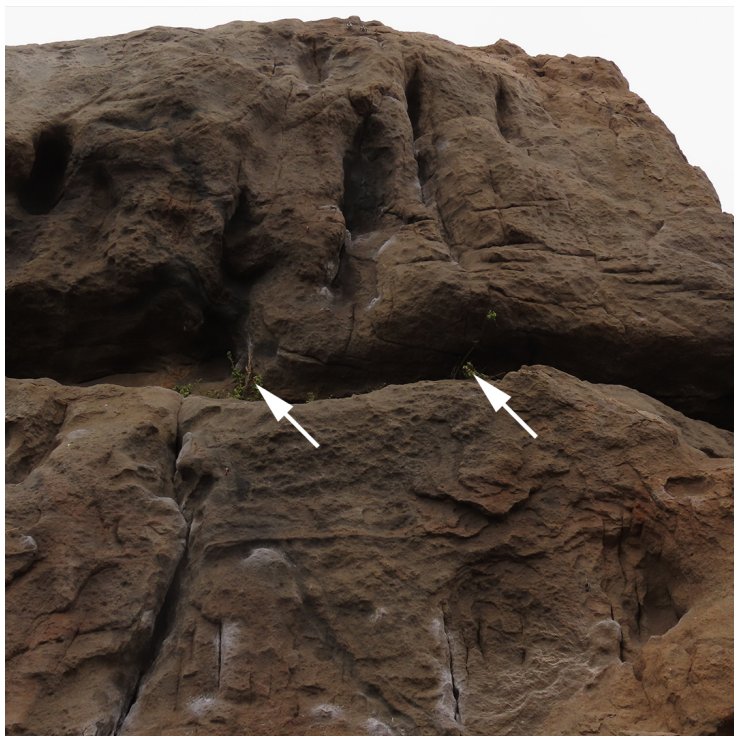
Figura 8. Rutas de escalada en medio del hábitat de Nicotiana rupicola . Fuerte Lambert, Coquimbo. 18-11-2021