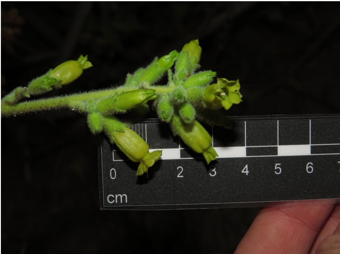
Figura 4. Nicotiana rupicola . Detalle de la inflorescencia y flores. Fuerte Lambert, Coquimbo. 12-11-2020.