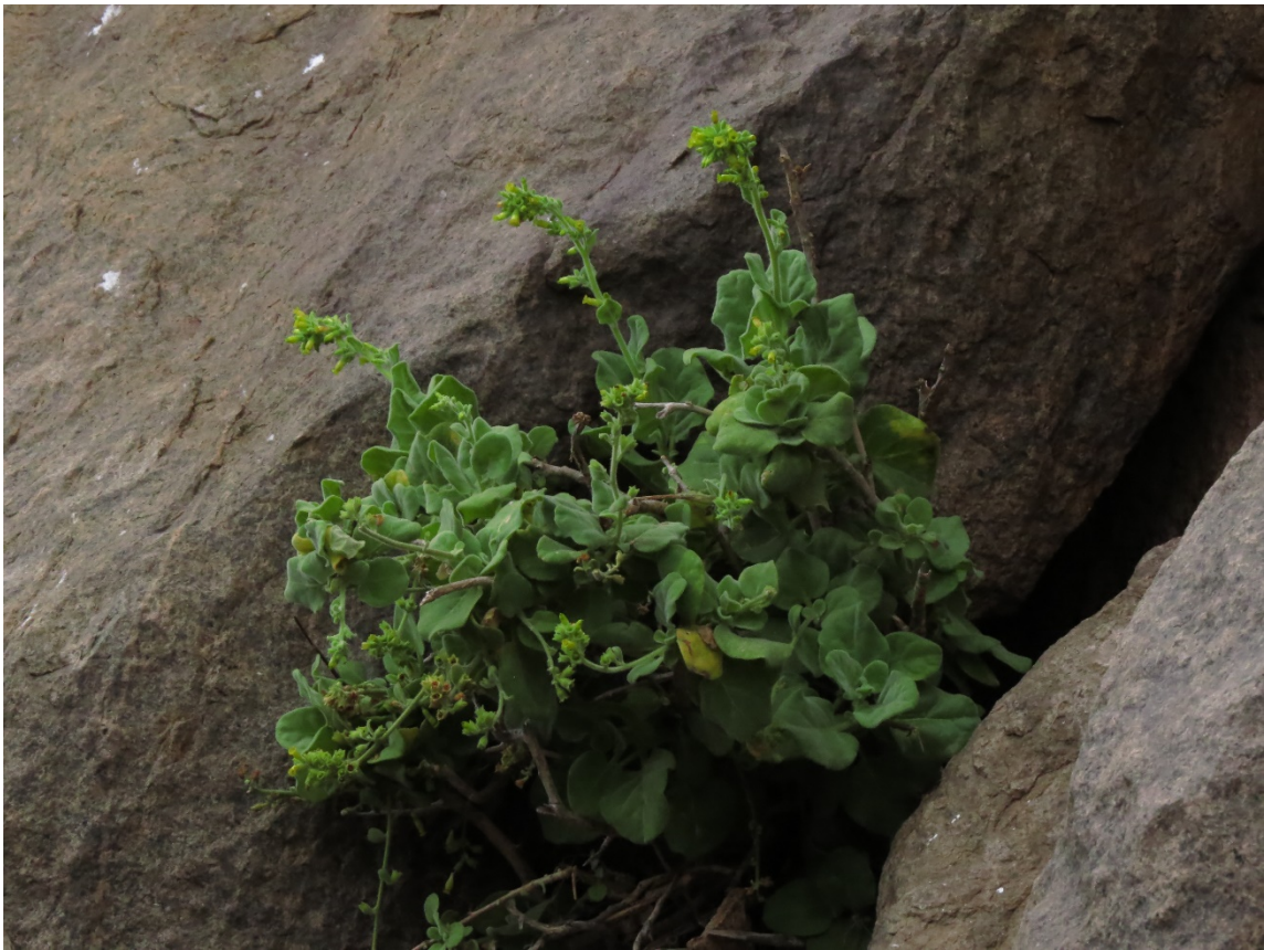
Figura 3. Nicotiana rupicola . Individuo creciendo entre las rocas. Fuerte Lambert, Coquimbo. 12-11-2020.