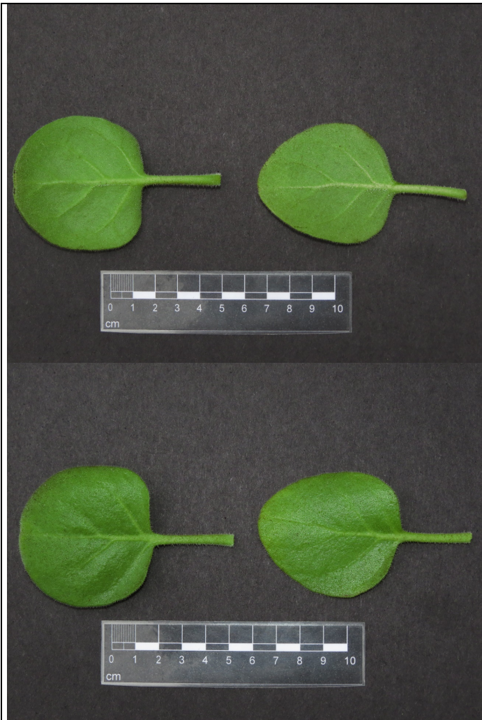
Figura 5. Nicotiana rupicola . Detalle del haz y el envés de las hojas. Fuerte Lambert, Coquimbo. 12-11-2020.