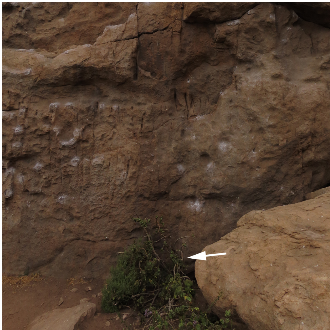
Figura 10. Ejemplar de Nicotiana rupicola pisoteado a los pies de ruta de escalada. Fuerte Lambert, Coquimbo. 18-11-2021