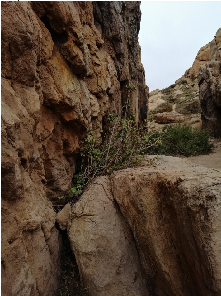
Figura 2. Nicotiana rupicola . Hábitat de la especie. Fuerte Lambert, Coquimbo. 12-11-2020.