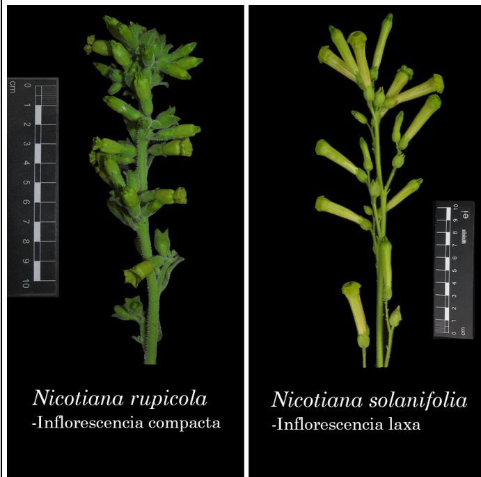
Figura 6. Comparación de inflorescencia de Nicotiana rupicola y Nicotiana solanifolia .