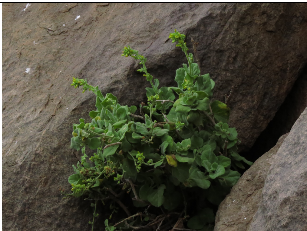
Nicotiana rupicola . Individuo creciendo entre las rocas. Fuerte Lambert, Coquimbo. 12-11-2020.