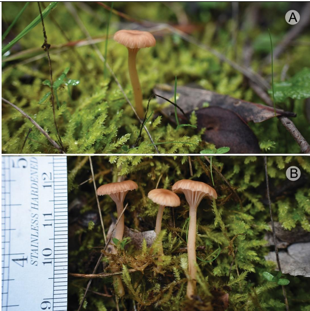
Figura 1: Registros fotográficos en el Cerro Poqui, A) vista lateral en su ambiente natural, y B) escala de tamaño con ejemplares colectados.