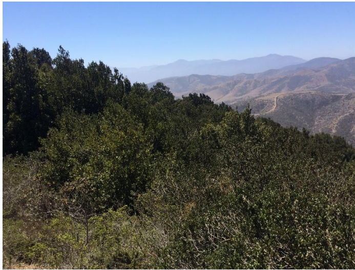
Fotografía 10. Hábitat en cerro Santa Inés.