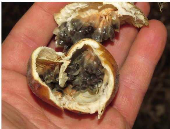
Fotografía 8. Detalle de las semillas (Autor: Nicolás Lavandero).