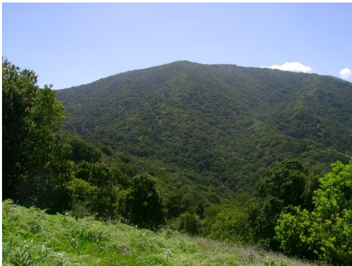
Fotografía 11. Hábitat en Quebrada El Tigre.