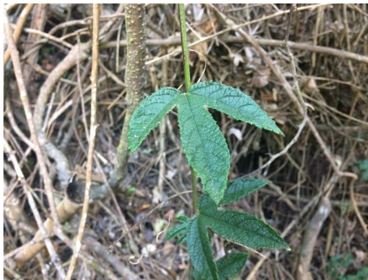
Fotografía 3. Detalle de la hoja (Autor: Cristian Ray).