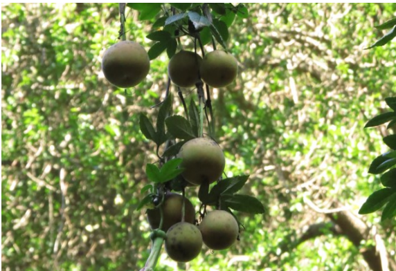
Fotografía 7. Detalle del fruto en estado inmaduro (Autor: Nicolás Lavandero).