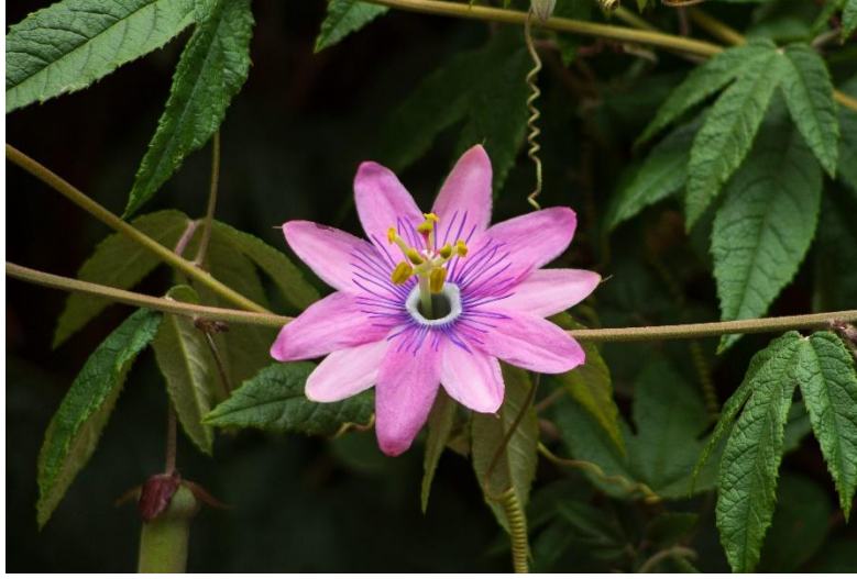
Fotografía 9. Detalle de la flor (Autor: Pedro Cavieres).