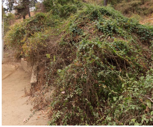
Fotografía 1. Hábito de crecimiento: arbusto trepador. Localidad de Zapallar.