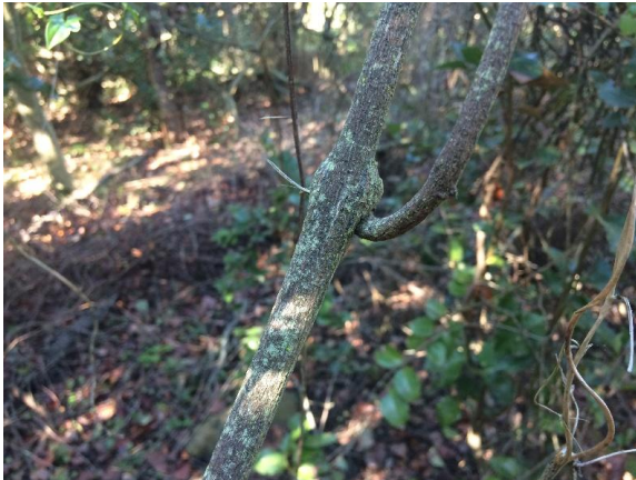
Fotografía 6. Detalle del tallo leñoso.