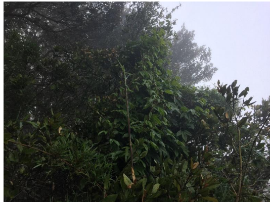
Fotografía 2. Hábito de crecimiento: arbusto trepador. Localidad de Cerro Santa Inés (Autor: Cristian Ray).