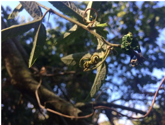
Fotografía 4. Detalle de zarcillos.