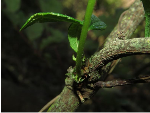
Fotografía 5. Detalle de estípulas (Autor: Nicolás Lavandero).