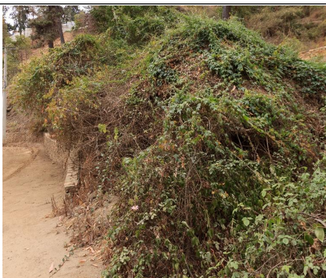
Fotografía 1. Passiflora pinnatistipula , hábito de crecimiento: arbusto trepador Localidad de Zapallar (Autor: Pedro Cavieres).

granadilla, flor de la pasión, pasionaria, pasiflora.