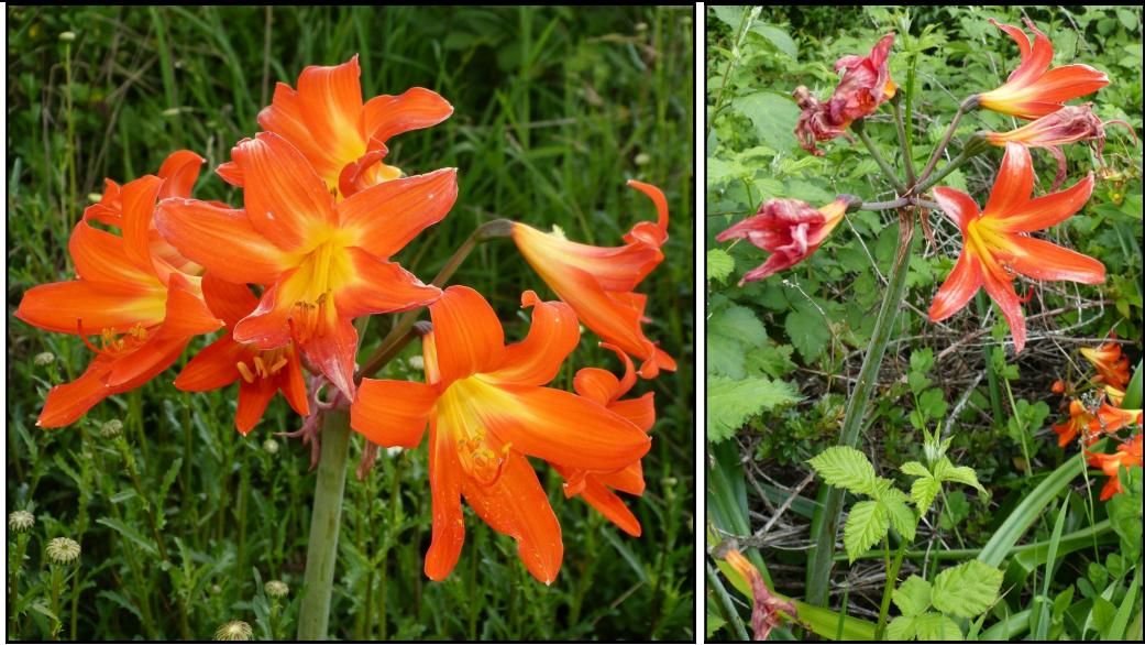
Fotografías de Phycella fulgens , a la izquierda se puede observar la umbela y a la derecha el individuo completo. Autor: Nicolás García Berguecio (2018).