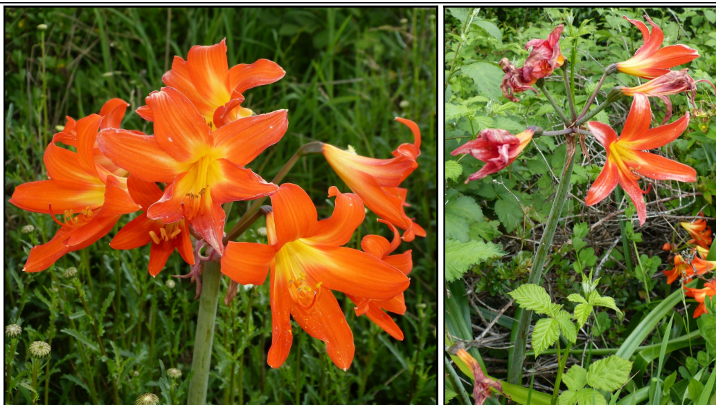
Fotografías de Phycella fulgens , a la izquierda se puede observar la umbela y a la derecha el individuo completo.

Actualmente no hay un nombre común asociado a la especie.