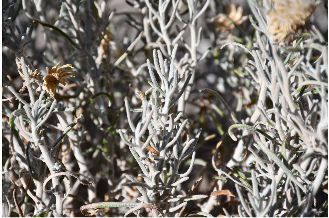
Senecio Jungei Phil. Hábito, detalle del capítulo (arriba) y de las hojas (abajo).