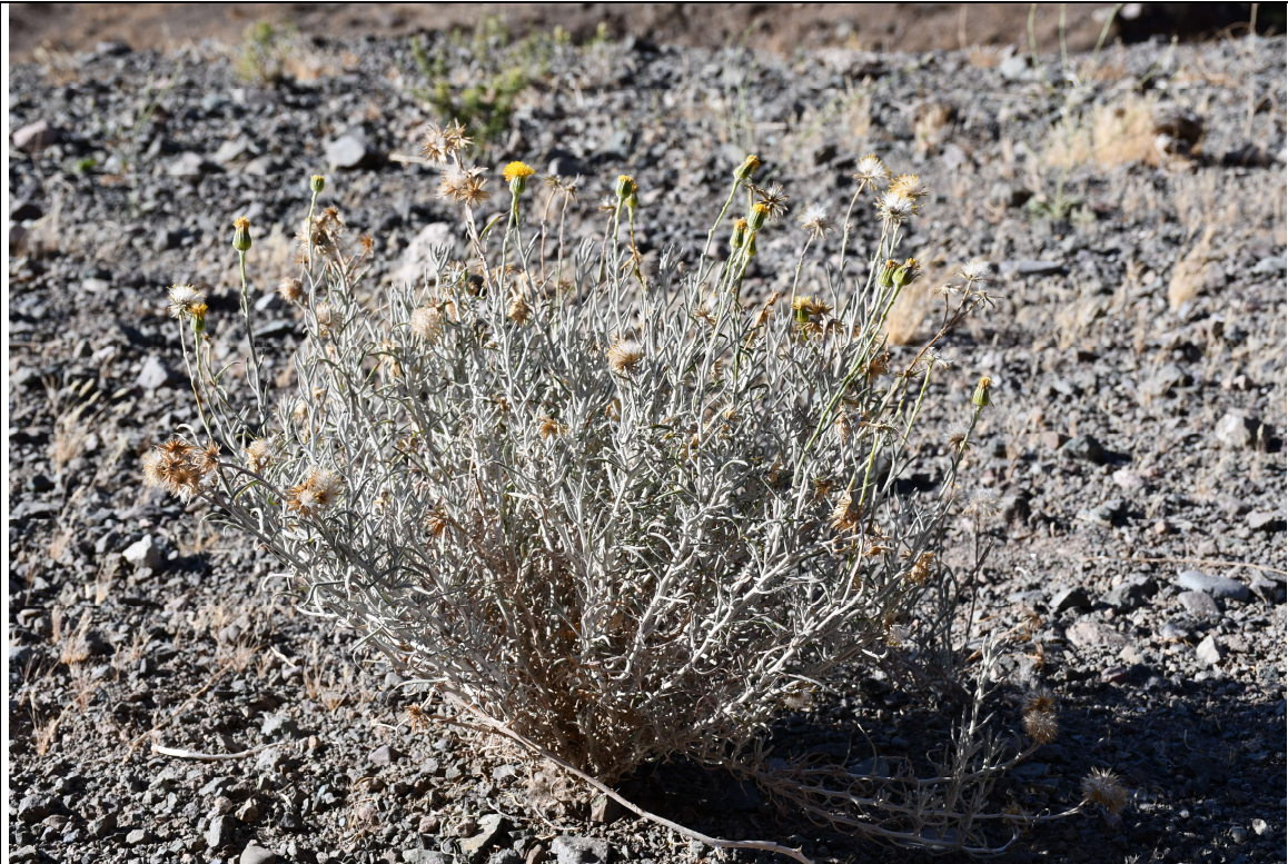
Senecio Jungei Phil. Hábito, planta creciendo a un costado del camino que rodea al Embalse Chacrillas, Putaendo.