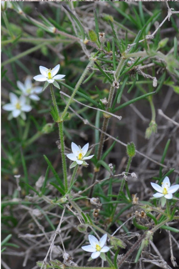
Figura 2. Registros de Spergularia aberrans obtenidos durante septiembre del 2019 en la Reserva Nacional La Chimba, Región de Antofagasta, Chile.