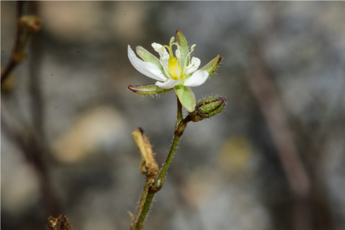
Figura 5. Flor de S. aberrans , presentando 5 estambres y los estilos unidos en la mitad inferior. Autoría: Sergio Ibáñez (se autoriza el uso de las fotografías).