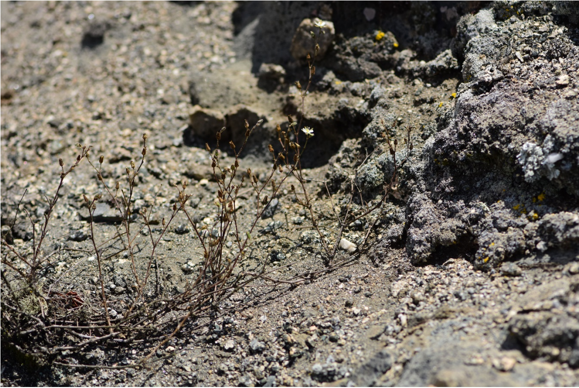
Figura 3. Hábito de S. aberrans , localizado en el Parque Nacional Morro Moreno. Autoría: Sergio Ibáñez (se autoriza el uso de las fotografías).