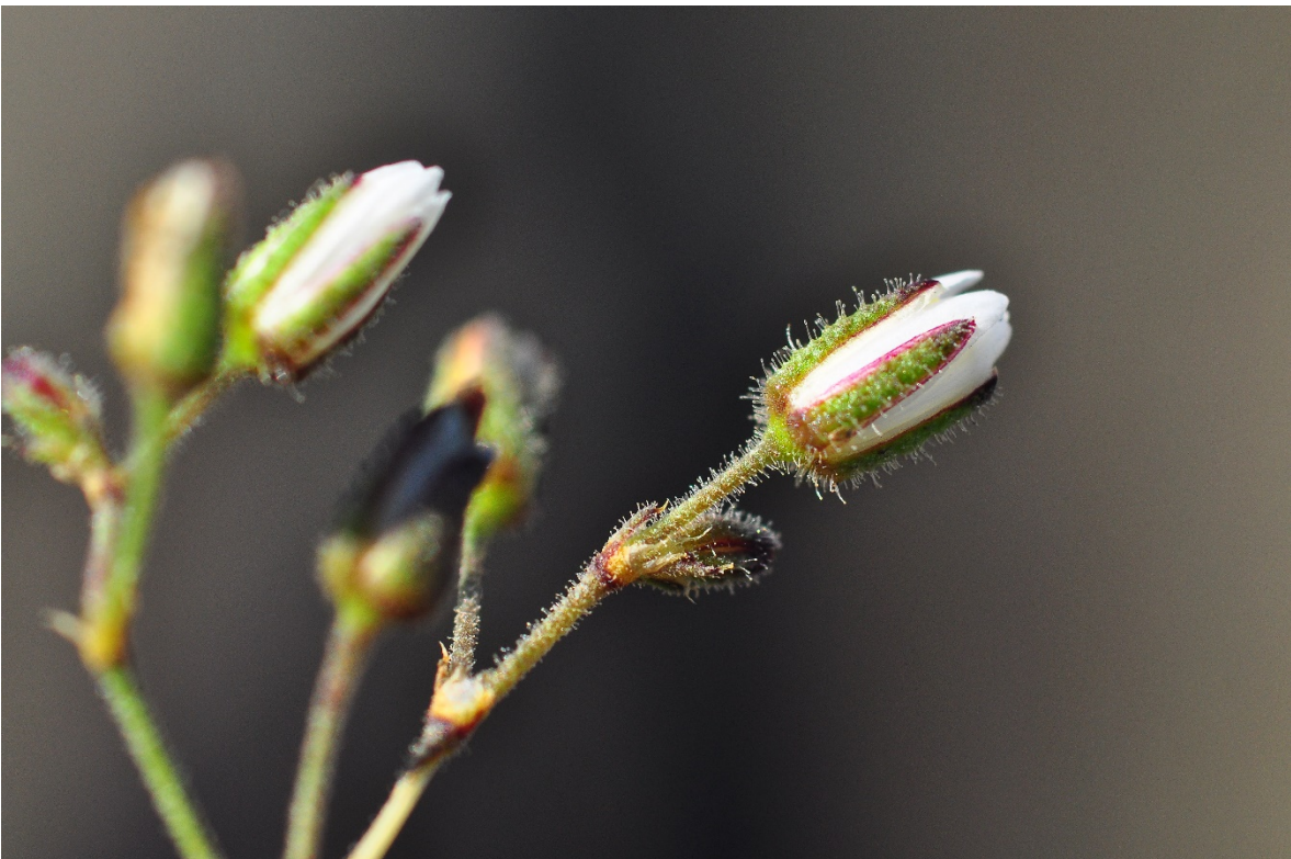
Figura 4. Parte superior de la inflorescencia de S. aberrans , mostrando los tallos y sépalos cubiertos de glándulas.