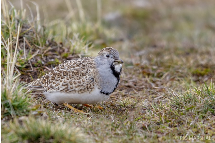
Perdicita chica.