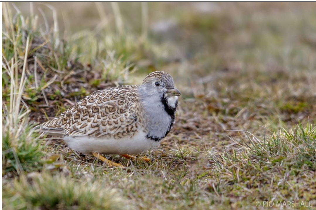
Perdicita chica.

Perdicita chica, perdicita común, perdicita