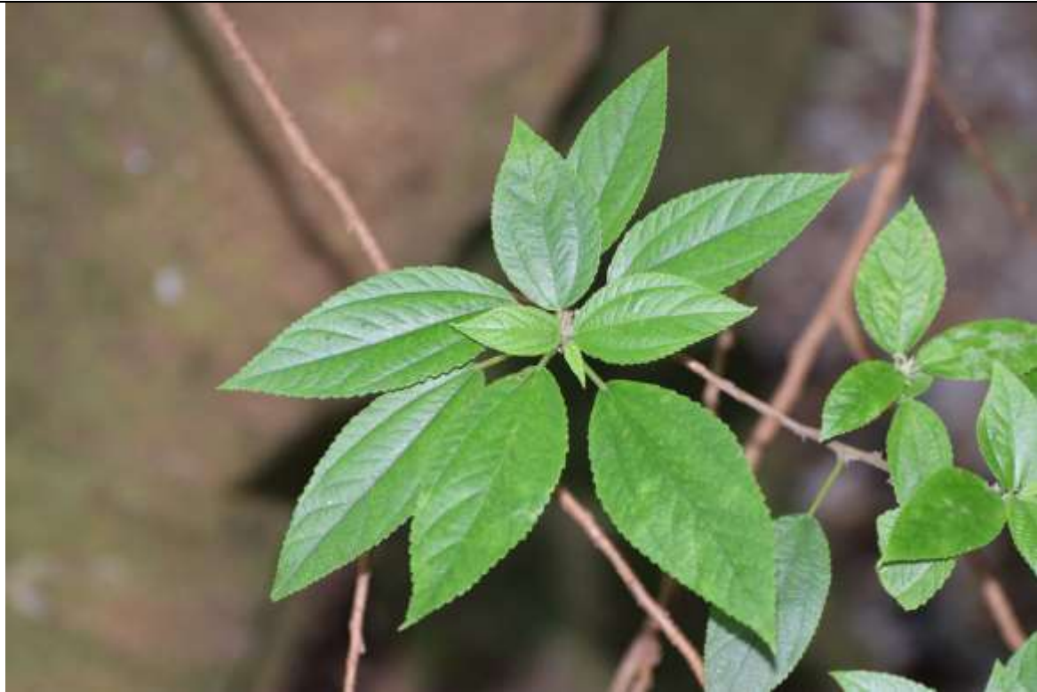
Boehmeria excelsa , hábito y detalle de las hojas.