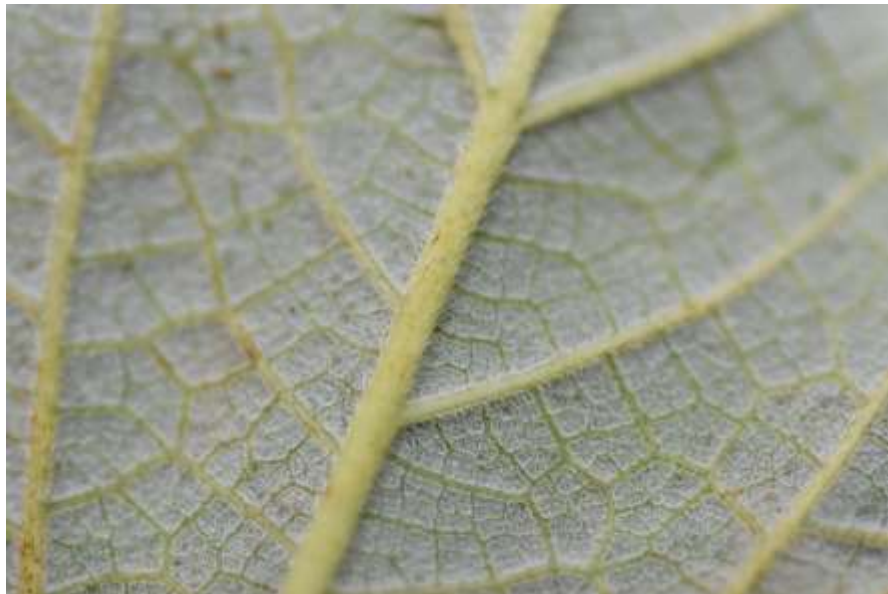
Boehmeria excelsa , detalle de la nervadura de la hoja (envés).