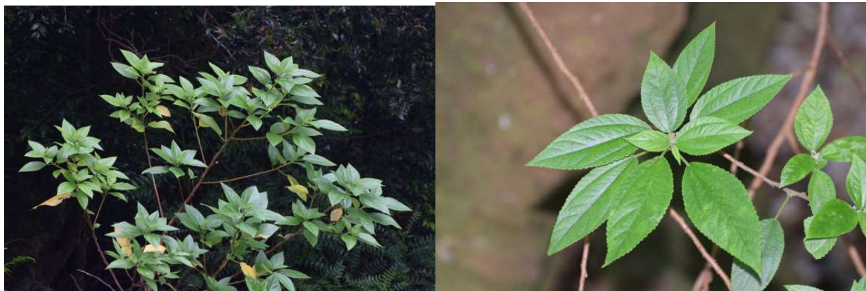
Boehmeria excelsa , detalle de las hojas y de las inflorescencias.