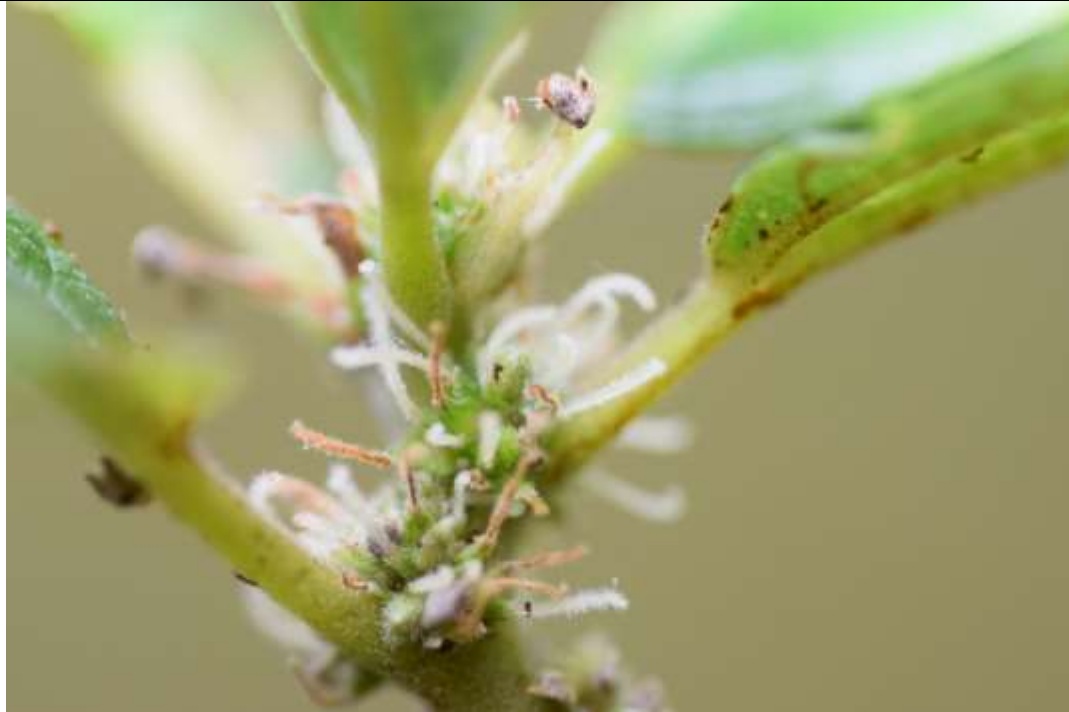
Boehmeria excelsa , detalle de las hojas y de las inflorescencias.