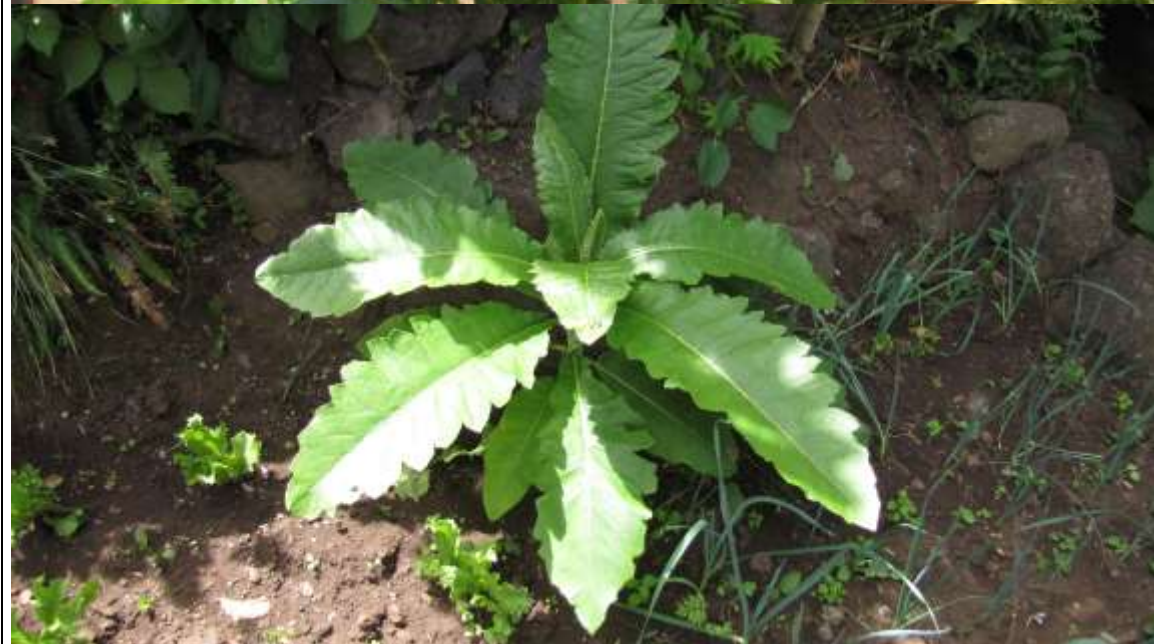
Dendroseris gigantea , individuos en cultivo en la isla Robinson Crusoe.