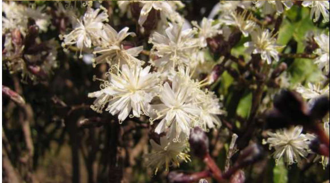
Dendroseris neriifolia , Arriba; individuos cultivados en la isla Robinson Crusoe, Abajo; detalles de los capítulos.