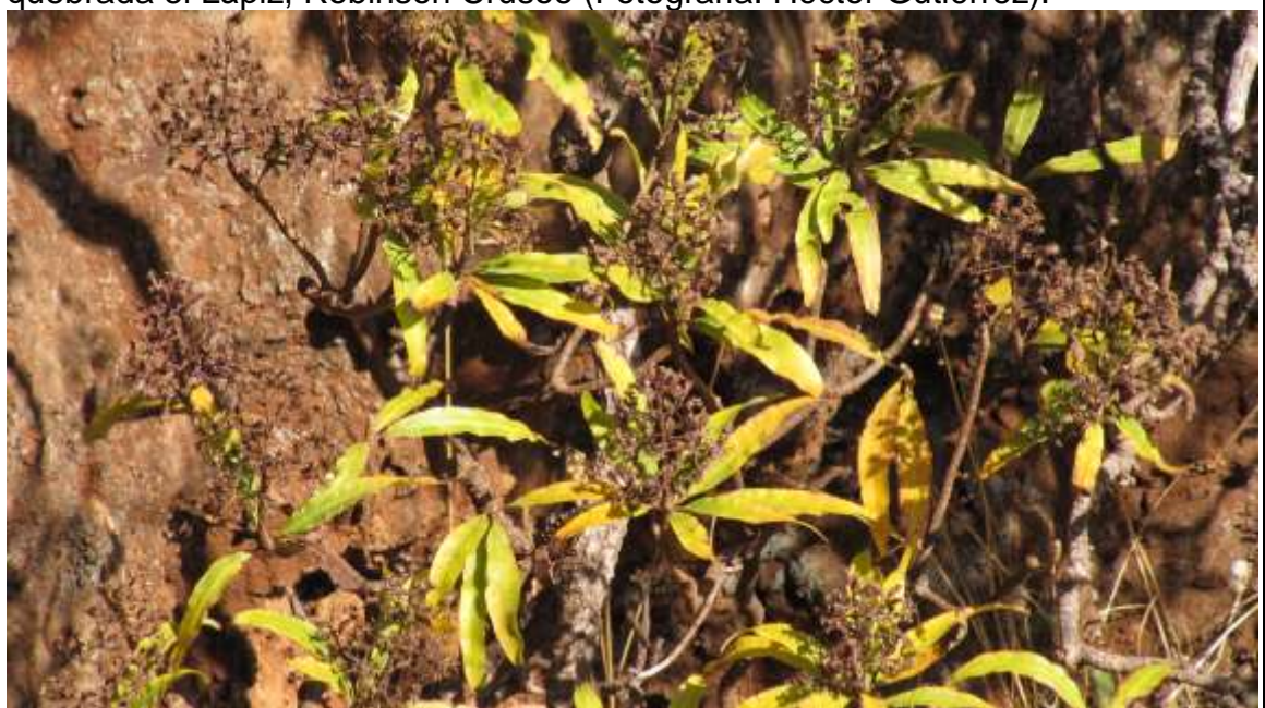
Dendroseris neriifolia , detalle de las inflorescencias, Quebrada el Lápiz.