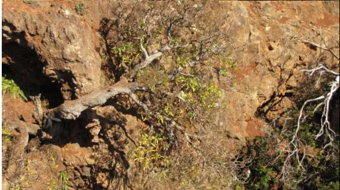
Último individuo en estado silvestre de Dendroseris neriifolia en una ladera de la quebrada el Lápiz, Robinson Crusoe.