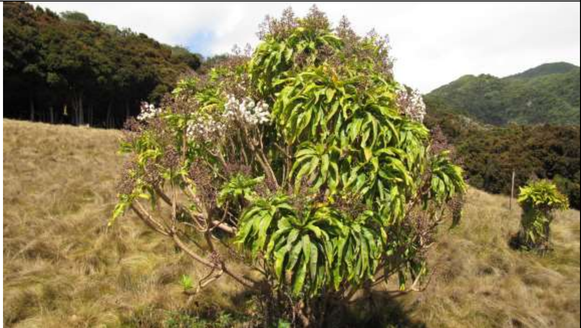
Dendroseris neriifolia , individuos cultivados en la isla Robinson Crusoe