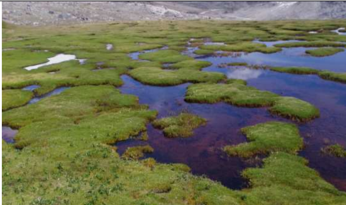
Bofedal con dominancia de Distichia filamentosa