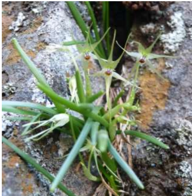
Figura 1. Registro fotográfico de M. stellata en cerro Quilhuica, comuna de Lampa.