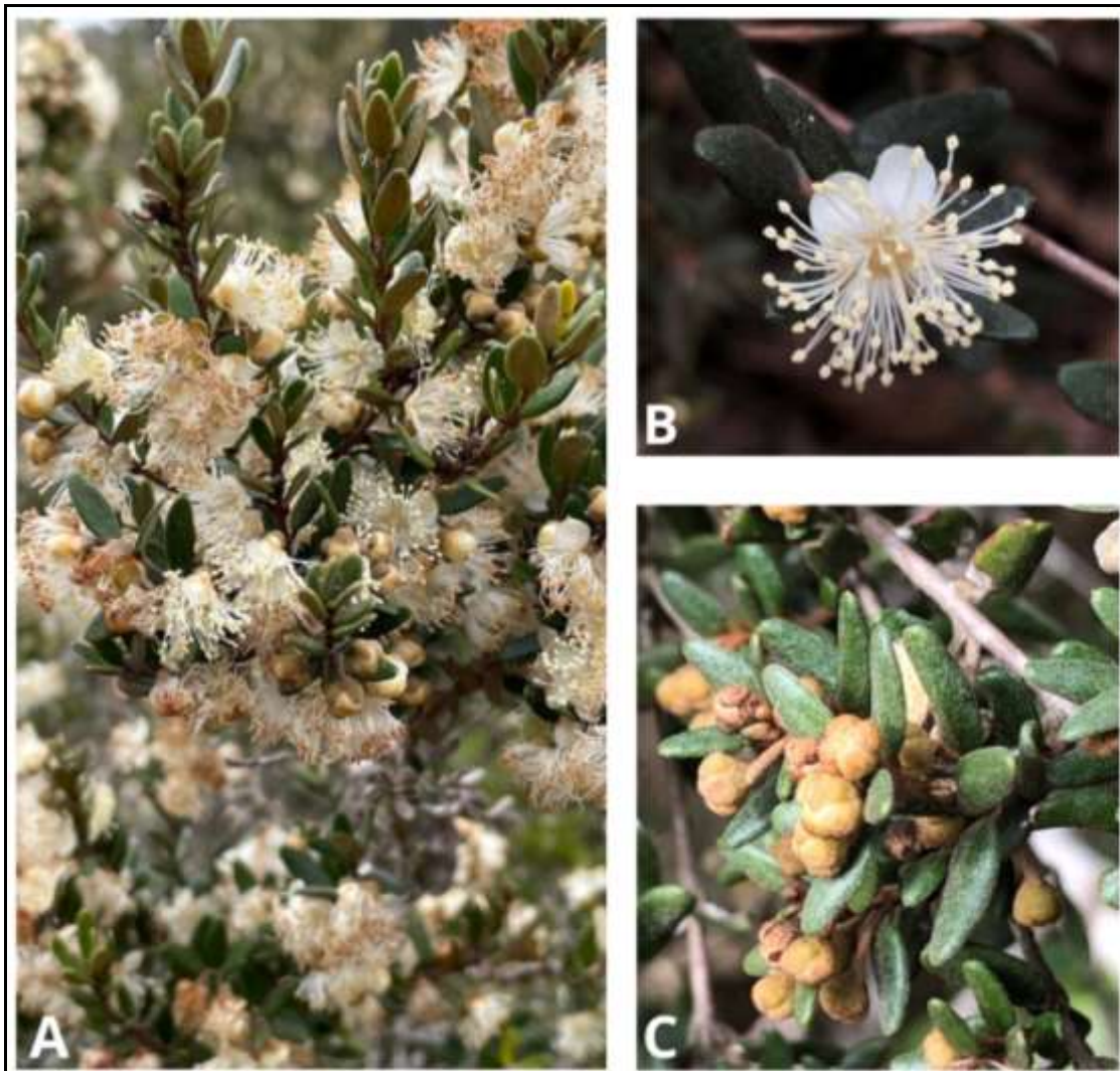
Figura 3. Registros fotográficos de Myrceugenia rufa tomada en la comuna de El Quisco; A) Detalles de flores, B) Detalle flor solitaria y C) Botones florales y hojas. Todas las fotos pueden ser utilizadas.