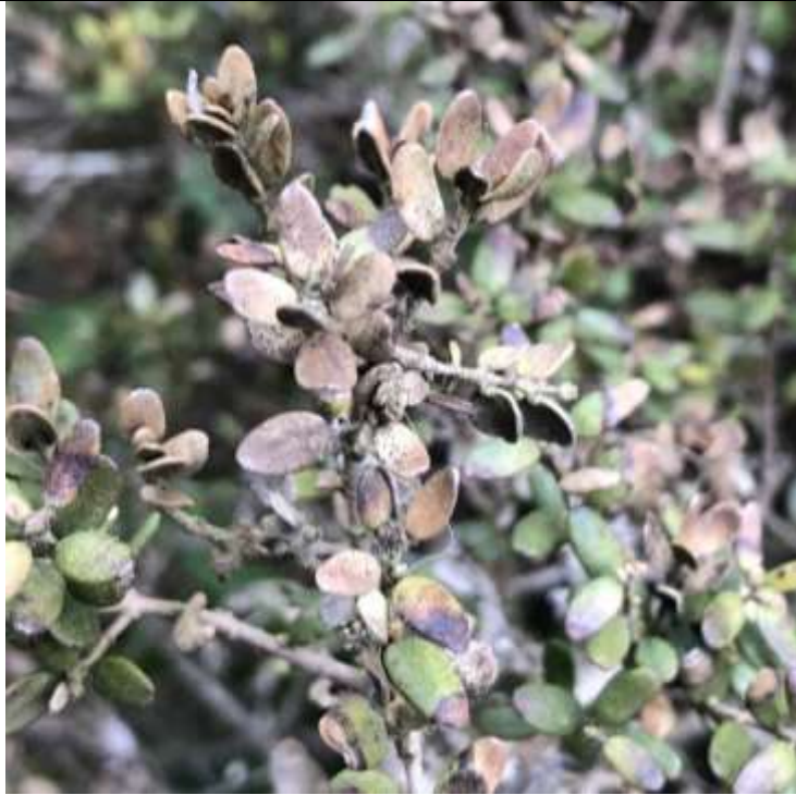
Figura 5. Registros fotográficos de hojas dañadas de Myrceugenia rufa tomadas por Eric Rojas A. en la comuna de Cartagena. La Fotografía puede ser utilizada.