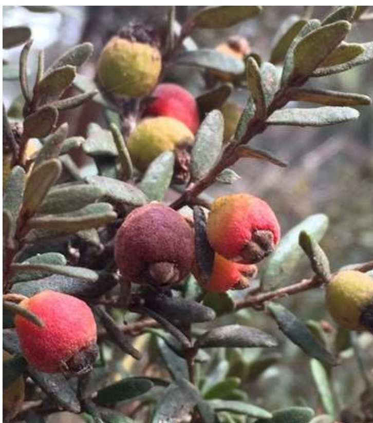
Figura 4. Frutos de Myrceugenia rufa registrados por Paula Miranda en la comuna de El Quisco. La Fotografía puede ser utilizada.