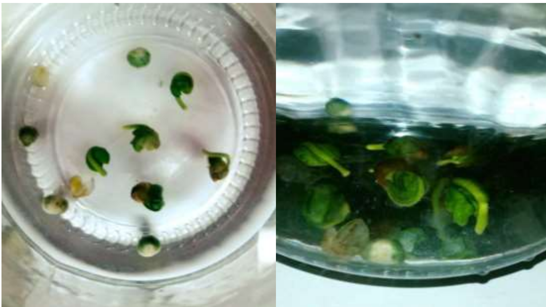
Figura 6 y 7. Registros fotográficos de semillas de hitigu maceradas en agua por Sebastián Lara Bastias, 31 de mayo de 2016. Registros fotográficos sacados del Grupo de Facebook de Propagación de flora nativa - Chile. Los registros fotográficos no pueden ser utilizados.