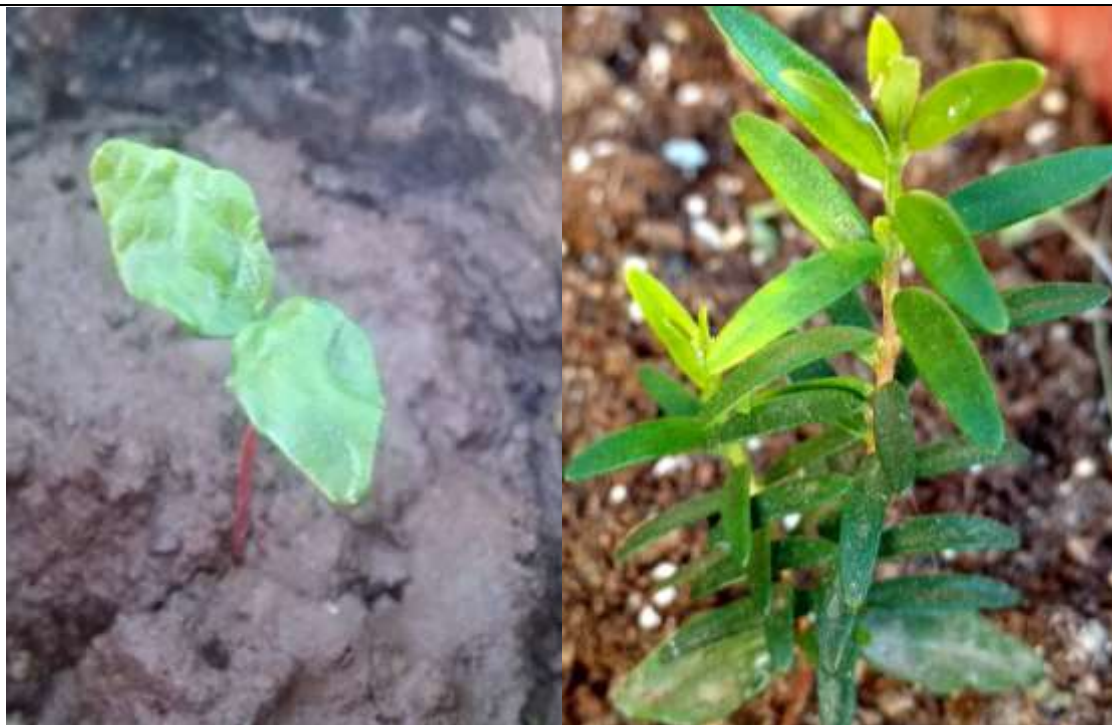
Figura 8 y 9. En la imagen de la izquierda se aprecia una plántula de hitigu con sus cotiledones abiertos, 4 de agosto de 2016. En la imagen de la derecha podemos observar un individuo de aproximadamente diez meses desde su germinación, 9 de febrero de 2017. Plantas propagadas por Sebastián Lara Bastías. Registros fotográficos sacados del Grupo de Facebook de Propagación de flora nativa - Chile. Los registros fotográficos no pueden ser utilizados.