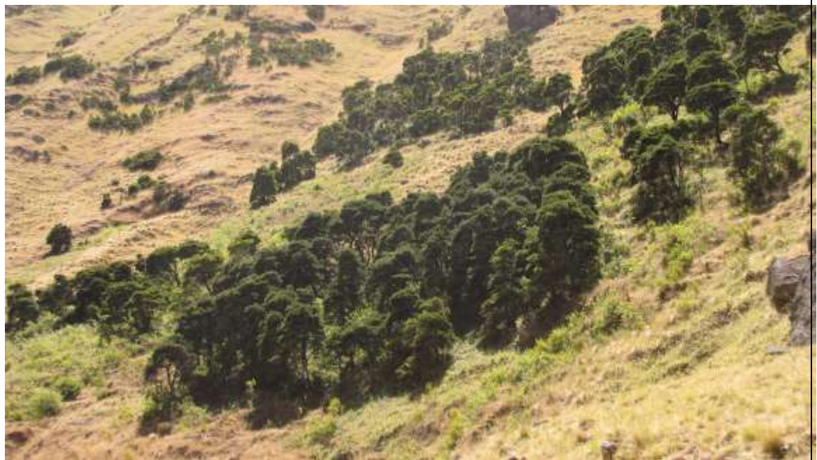
Parches de bosque remanente de Myrceugenia schulzei dentro de una matriz de pastizales con presencia de herbáceas exóticas.