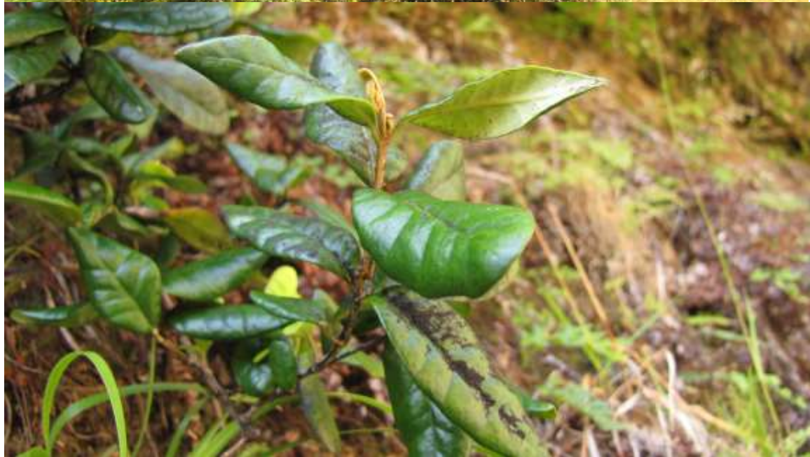
Individuos de Myrceugenia schulzei creciendo en un bosque remanente de mirtisilva (arriba) y detalle de las hojas (abajo).