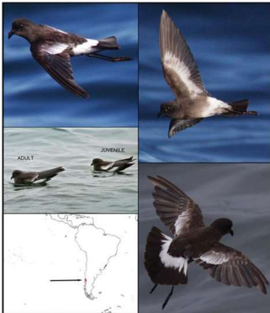
Fig. 2. Identification features and at-sea distribution of the Pincoya Storm Petrel ( Oceanites pincoyae ). (Images by P. Harrison, Seno Reloncavi, Chile, February 2011.)

golondrina de mar Pincoya, Pincoya Storm-petrel