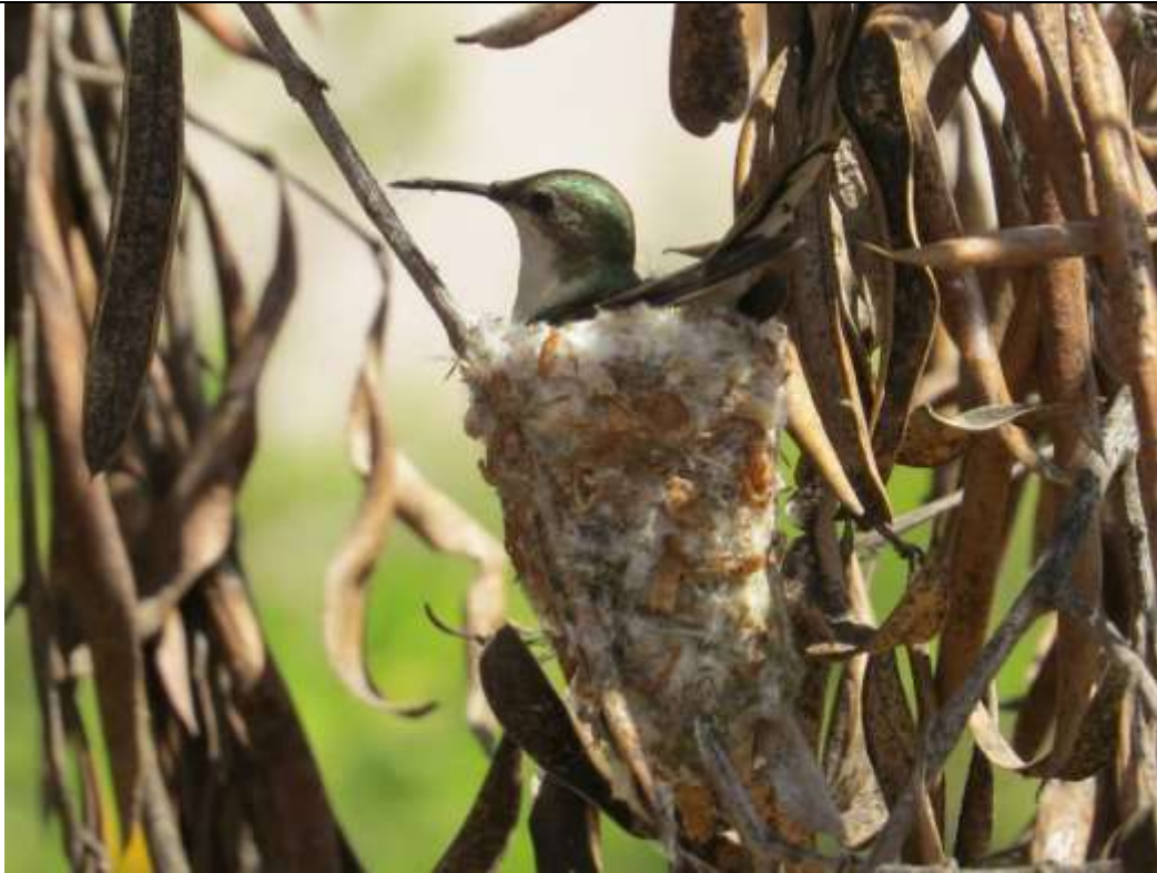
Imagen 3. Picaflor de Cora hembra nidificando.