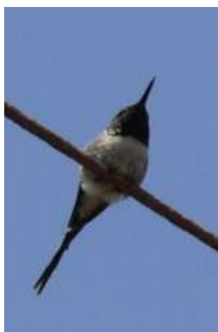
Imagen 2: Picaflor de Cora macho adulto sin las rectrices centrales. Autor: Cristián F. Estades