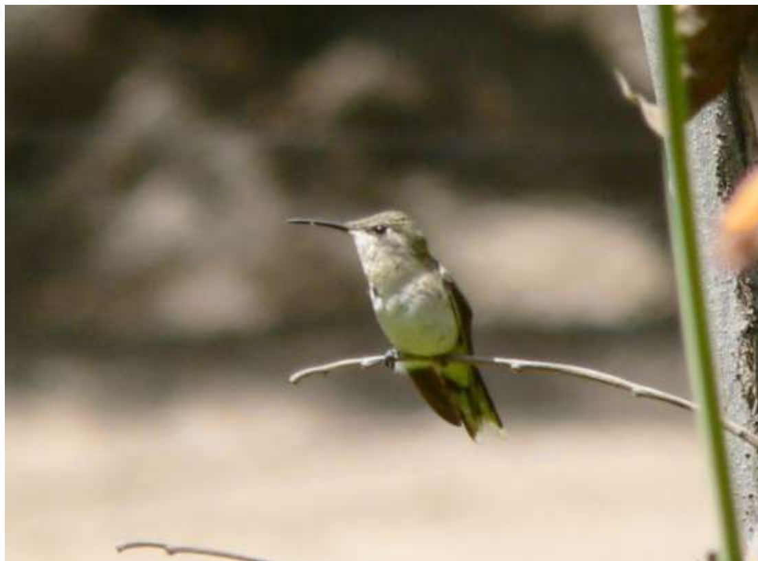
Picaflor de Cora hembra. Autor: Cristián F. Estades.

Picaflor de Cora, colibrí de Cora, Peruvian Sheartail (inglés).