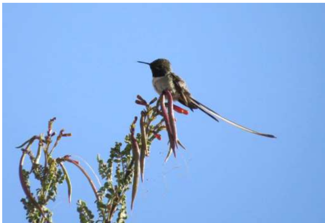
Imagen 1. Picaflor de Cora macho adulto con cola entera.