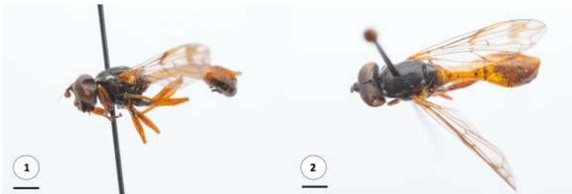
Figuras 1-2. Valdiviomyia ruficauda (Shannon, 1927): (1) habito lateral; (2) habito dorsal.