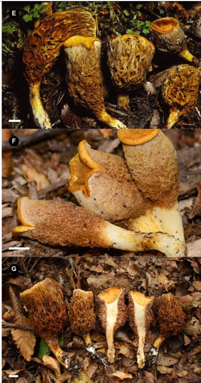
Fig. E) Detalle de basidiomas encontrados en Lago Grey; Host: N. pumilio x N. betuloides (Roy Halling, 12-III-1988). Fig. F) Detalle de basidiomas encontrados en Parque Nacional Torres del Paine; Host: N. pumilio (Damon Tighe, 06-III-2016). Fig. G) Detalle de basidiomas encontrados en Reserva Nacional Altos de Lircay; Host: N. obliqua (Christian Valdés, 29-IV-2024)..