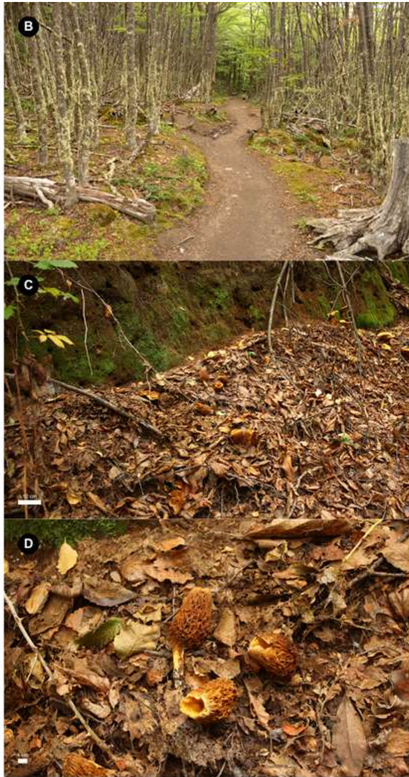
Fig. B) Detalle del ambiente de Gymnopaxillus morchelliformis ; Host: Nothofagus pumilio , Parque Nacional Torres del Paine (Damon Tighe, 06-III-2016). Fig. C & D) Basidiomas in situ en Reserva Nacional Altos de Lircay; Host: Nothofagus obliqua (Christian Valdés, 29-IV-2024).